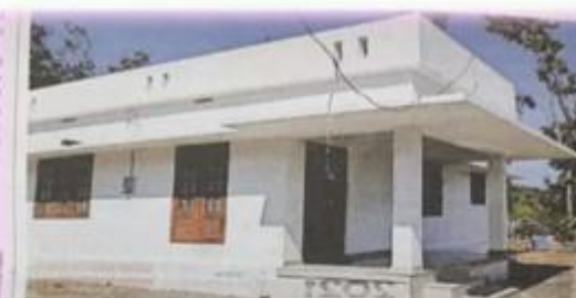
ഓൺ സീൻ കോളേജിലെ ഏ.സി.എസ്. യൂണിറ്റ് വർദ്ധന കെട്ടിപ്പറയുന്നതിനായി നിർമ്മിച്ച സർവീസ് സ്കീം